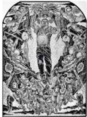
Universidad del estado de Tejas San Antonio, San Antonio, Texas Juan de Dios Mora (México / EE.UU, b. 1984) Asunción del emigrante , 2009 (Linogrado)

Las planchas de relieve generalmente están hechas de madera o linóleo, similar al material utilizado para hacer pisos. El artista recorta el exceso de material, dejando una imagen en relieve. La tinta se enrolla en el área elevada utilizando una rodilla y la imagen se transfiere al papel utilizando la presión de una prensa de impresión o puliendo el papel con un baren o una cuchara de madera.