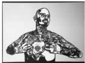
Múltiples modernos Los Angeles, California, EE.UU. Sonia Romero (EE.UU, b. 1980) Corazón sagrado , 2013 (Serigrafía)

Serigrafía utiliza sténcil. En su forma más básica, un artista corta un diseño de una hoja de papel o plástico y lo coloca en una pantalla de malla de nailon. Luego empuja la tinta a través del esténcil y la malla, transfiriendo la imagen usando la presión creada por sus propios cuerpos sobre el papel con una herramienta de goma.