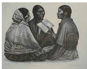
People's Graphic Workshop Mexico City, Mexico Elizabeth Catlett (USA / Mexico, 1915 – 2012) Learning to Read , c.1950 (Lithograph)

Lithography, a planographic process, requires a special limestone that is only found in Bavaria, Germany. The artist draws on the porous stone with a greasy crayon then treats the stone chemically to 'etch' the picture on the surface. The stone is passed through a printing press, where the paper lifts the ink from the stone's surface.