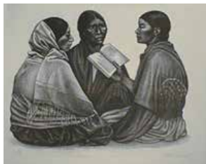
Taller de gráfica popular Ciudad de México, México Elizabeth Catlett (EE.UU/México, 1915 - 2012) Alfabetizando , c.1950 (Litografía)

La litografía, un procesoplanográfico, requiere una piedra caliza especial que solo se encuentra en Baviera, Alemania. El artista dibuja en la piedra porosa con un crayón grasiento y luego trata la piedra químicamente para "grabar" la imagen en la superficie. La piedra se pasa a través de una prensa de impresión, donde el papel recoge la tinta de la superficie de la piedra.