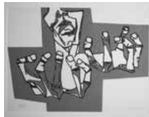
Ediciones polígrafa Barcelona, España Oswaldo Guayasamín (Ecuador, 1919 - 1999) Las manos de la ira , 1973 (Aguafuerte)

Las planchas para intaglio pueden estar hechas de láminas de metal o plástico. Usando una herramienta de metal afilada, el artista crea la imagen raspando y rayando la superficie. La tinta es empujada en las líneas grabadas. La presión de la prensa recoge la tinta de las incisiones. ¡Esto es lo que se verá en el papel una vez que se imprima!