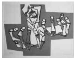
Polygraph Editions Barcelona, Spain Oswaldo Guayasamín (Ecuador, 1919 – 1999) The Hands of Ire , 1973 (Etching)

Intaglio plates can be made from sheets of metal or plastic. The artist scratches or scrapes the image into the surface of the plate using a sharp metal tool. Ink is pushed into the engraved lines. The pressure of the press lifts the ink out of the incisions. This is what will be seen on the paper once it's printed!