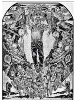
University of Texas at San Antonio, San Antonio, Texas Juan de Dios Mora (Mexico / USA, b. 1984) Assumption of the Immigrant , 2009 (Linoleum Cut)

Relief plates are usually made from wood or linoleum, similar to the material used to make flooring. The artist cuts away excess material, leaving a raised image. Ink is rolled onto the raised area using a brayer and the image is transferred onto the paper using pressure from a printing press or by burnishing the paper with a baren or wooden spoon.