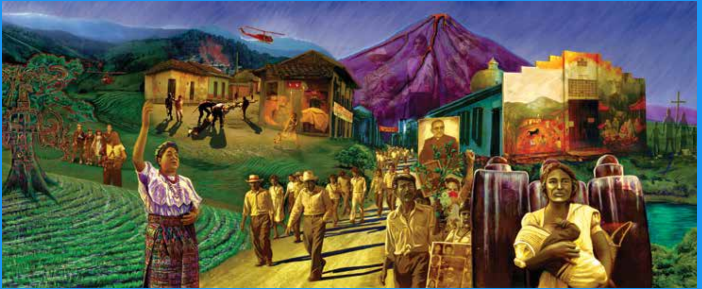
Judith F. Baca (United States, b. 1946) CARECEN: Migration of the Golden People / CARECEN: Migración del Pueblo Dorado, 2003-2021 Digital print on gold aluminum substrate / Impresión digital sobre sustrato dorado de aluminio H 95 x W 230 inches / pulgadas Collection of the artist / Colección de la artista