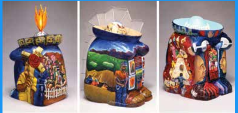
Judith F. Baca (United States, b. 1946) Pancho Trinity I, II, III / La Trinidad de los Panchos I, II, III, 1993 Acrylic paint, mixed media, urethane on styrofoam / Pintura acrílica, medios mixtos, uretano sobre poliestireno H 26 x W 18 x D 20 inches (each) / pulgadas Collection of the artist / Colección de la artista