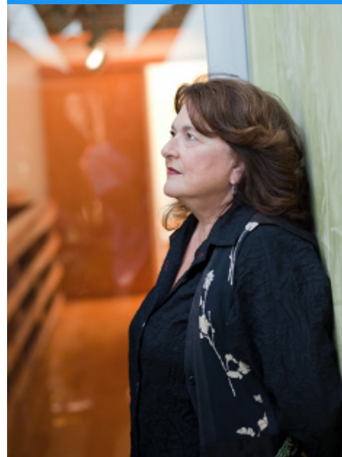
Dr. Judy Baca Artist, Educator, Scholar/Activist, Community Arts Pioneer, UCLA Professor Emeritus and Founder of the Social and Public Art Resource Center (SPARC)

Judy Baca es una pintora y muralista de renombre internacional, pionera de las artes comunitarias y académica que ha estado enseñando en el sistema de la Universidad de California durante más de 30 años. Es fundadora del primer Programa muralista de la ciudad de Los Ángeles en 1974, que evolucionó en la organización sin fines de lucro Centro de Recursos de Arte Social y Público (SPARC). Baca se ha dedicado a la creación de sitios de memoria pública dentro de comunidades históricamente desfavorecidos. Actualmente, ella continúa sirviendo como directora artística de SPARC mientras emplea tecnología digital para co-crear diseños de murales colaborativos en el Laboratorio de Murales Digitales César Chávez de UCLA / SPARC.